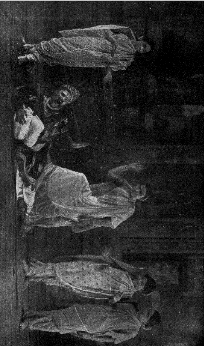
दृ० — नवप्याला लाथा मारतिस —